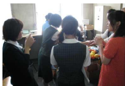
女性の参加が圧倒的。