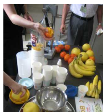
ちょっとしたジューススタンドのようです。