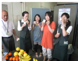
“ビタミンたっぷりですよ”“肌に良いかも”等コメント。