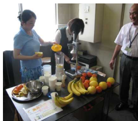
社内リフレッシュコーナーにて。グレープフルーツの爽やかな酸味が漂います。

午前中の短時間ではありましたが、社内のリフレッシュコーナーを使い、試飲を行いました。試飲メニューは、シトラスミックスジュース。南アフリカ産グレープフルーツ(今回はホワイトを使用)、オーストラリア産ミネオラ、バナナにはちみつ少々をミキサーにかけました。“ドライフルーツを足すともっと健康に良いかも”“グレープフルーツは絞り汁ではなく、ざくざくっと切っ入れてみては”“朝食にちょうどよい”“ミックスジュースだといろんなフルーツや野菜がたっぷりとれる”“酸味があって、体がしゃっきりする感じ”“リフレッシュに良い”等いろいろな意見が飛び交いました。